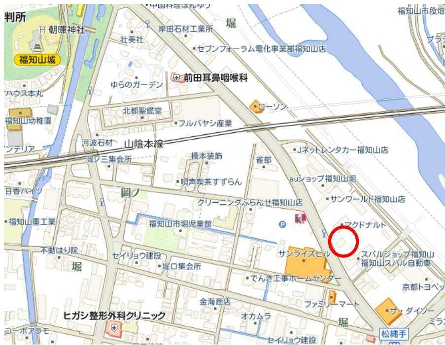
掲載図は概略です。実際と異なる場合は現状を優先させていただきます。