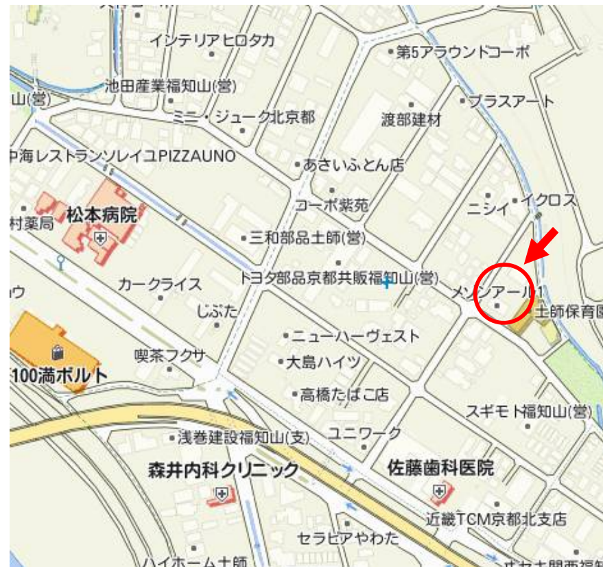
掲載図は概略です。実際と異なる場合は現状を優先させていただきます。