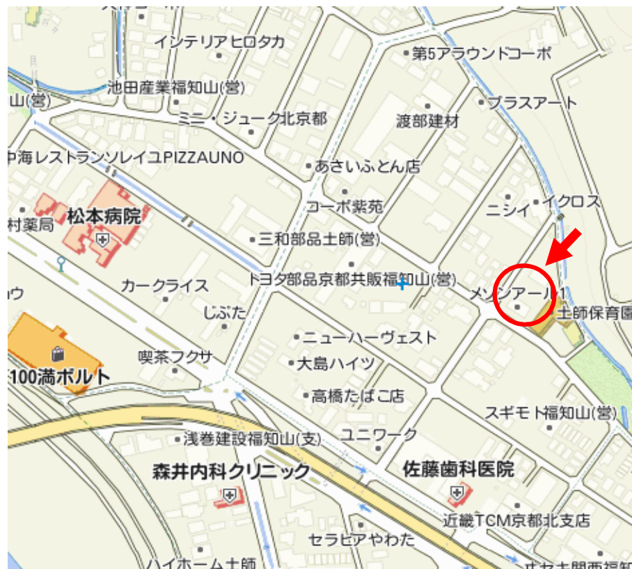
掲載図は概略です。実際と異なる場合は現状を優先させていただきます。